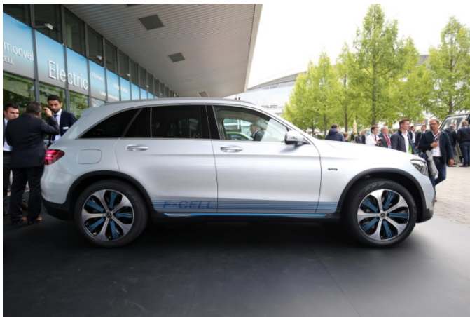
図 1 メルセデスベンツ試作モデル外形 (参考資料 1 より)

フランクフルトで行われた IAA 国際モーターショーで、メルセデス・ベンツは新型メルセデス・ベンツ GLC F-CELL の試作モデルを発表した。この最新のモデルでは EQ Power(※) システムの下で、燃料技術とバッテリー技術をプラグインハイブリットの形で組み合わせている。